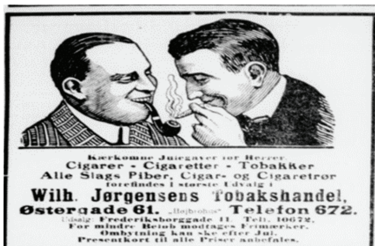
Holstebro Dagblad 1919