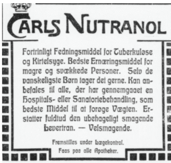
Riget. Illustreret Dagblad 1913