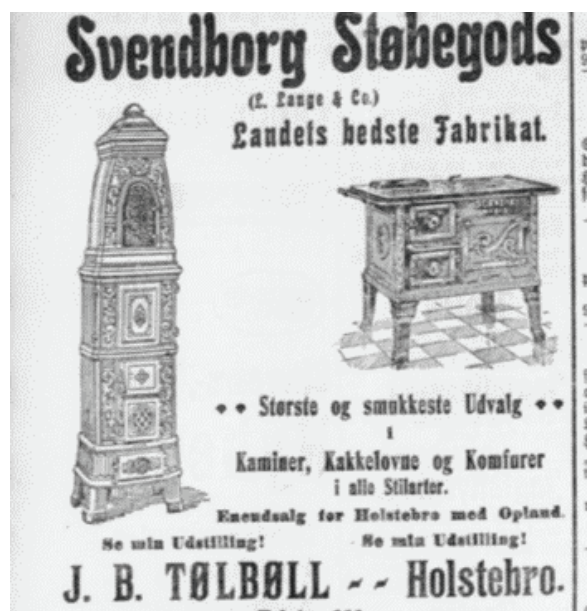
Holstebro Dagblad 1910